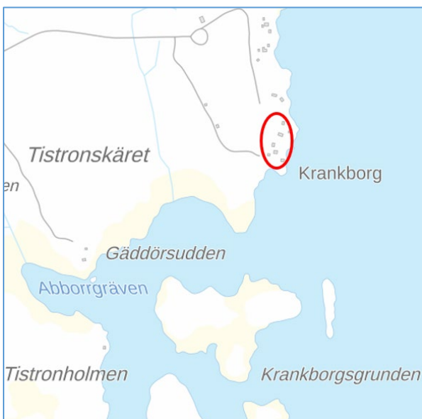
Kuva 1. Suunnittelualueen likimääräinen sijainti. Taustakartta MML

Alueen Likimääräinen sijainti on esitetty kuvassa 1 ja suunnittelualueen rajaus kuvassa 2.