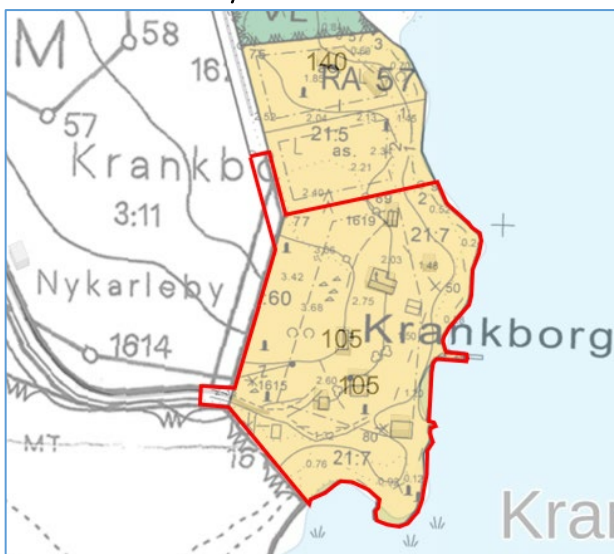
Kuva 4. Ote alueella voimassa olevista ranta-asemakaavoista. Suunnittelualueen rajaus punaisella.

Alueella ei ole voimassa olevaa asemakaavaa.